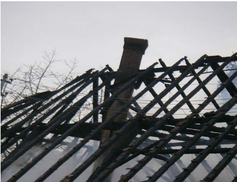
Abbildung 16: Schornstein kurz vor dem Einstürzen nach einem Dachstuhlbrand

Einsturzgefährdet ist bei längerer Brandeinwirkung auch der Schornstein. Schornsteine sind sehr lange und dünne Gebilde, welche sehr leicht einknicken. Schornsteine werden aus diesem Grund seitlich durch den Dachstuhl gestützt. Brennt diese Stütze weg, so verliert der Schornstein erheblich an Stabilität und kann leicht z. B. durch Erschütterungen oder Windböen zum Einsturz gebracht werden.