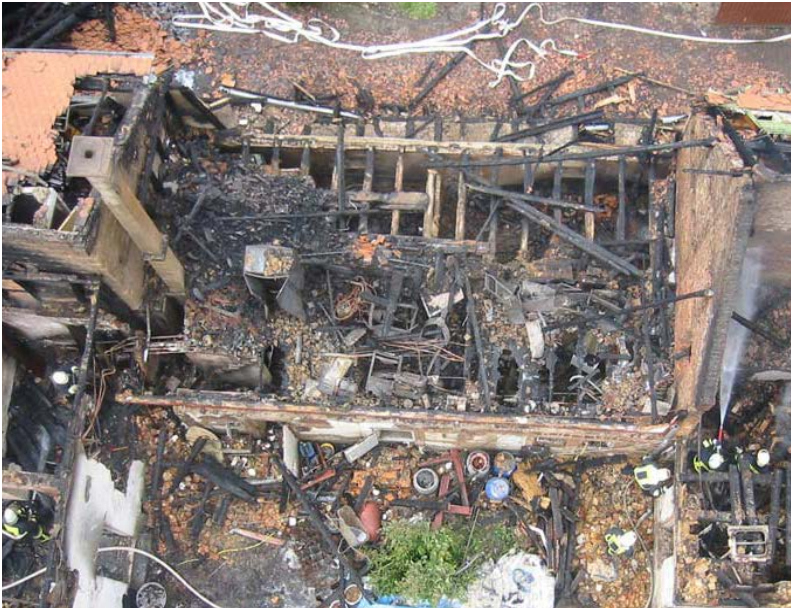
Abbildung 17: Komplett eingestürzter Dachstuhl nach einem Brand – Die Schäden am hölzernen Dachstuhl lassen auf eine Branddauer von bis zu 50 min schließen