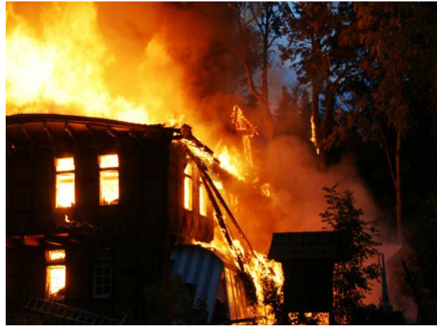
Abbildung 15: Einstürzende Giebelwand bei einem Dachstuhlbrand