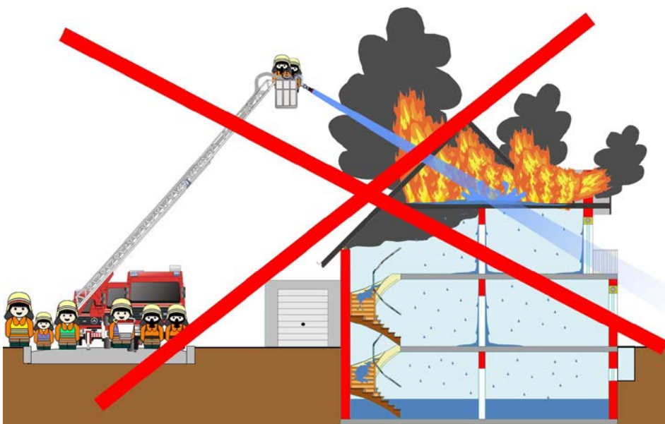
Abbildung 19: Bei einem Dachstuhlbrand in einem Wohnhaus wird ein Wenderohr nicht eingesetzt

Ein Wenderohr wird bei einem Wohnhausbrand/Dachstuhlbrand nicht eingesetzt! Von der Drehleiter aus wird die Brandbekämpfung mit einem C-Strahlrohr und mit Sprühstrahl durchgeführt