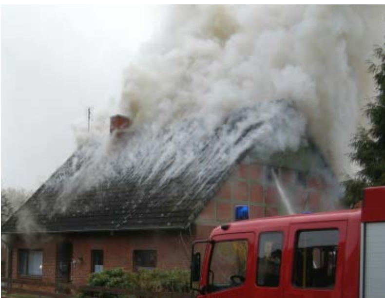
Abbildung 5: Typische Rauchentwicklung als Anzeichen eines bevorstehenden Aufbrennens des Dachstuhls

Ein solches Aufbrennen lässt sich nicht sicher vorhersagen, jedoch zeigt sich oftmals vor einem Aufbrennen eine typische Rauchentwicklung. Das Aufbrennen eines Dachstuhls und die Rauchentwicklung stehen grundsätzlich in keinem Zusammenhang. Ein Aufbrennen eines Dachstuhls ist von der Abbrandgeschwindigkeit an den Dachlatten abhängig und tritt nach rund 15 bis 30 Minuten Brandeinwirkung auf die Dachlatten ein (siehe Abschnitt 1.3. ). Dies setzt aber einen deutlich fortentwickelten Brand voraus, der auch eine typische Rauchentwicklung zeigt: Der Rauch drückt in diesem Fall auf großer Fläche zwischen den Ziegeln hindurch, was zu einer besonderen Musterung im Rauch führt (siehe Abbildung 1, 4, 5, 6 und 8). Optisch erweckt dies den Anschein einzelner „Rauchstreifen“ oder eines „Gitters“ über der Dachfläche. Erst über dem Dach nimmt der Rauch an Volumen zu und steigt nur noch langsam auf. Die Rauchfarbe ist dabei meist hellgrau. Achtung: Bei starker Isolierung des Daches kann diese Rauchentwicklung auch nur sehr gering ausfallen und kaum beobachtbar sein.