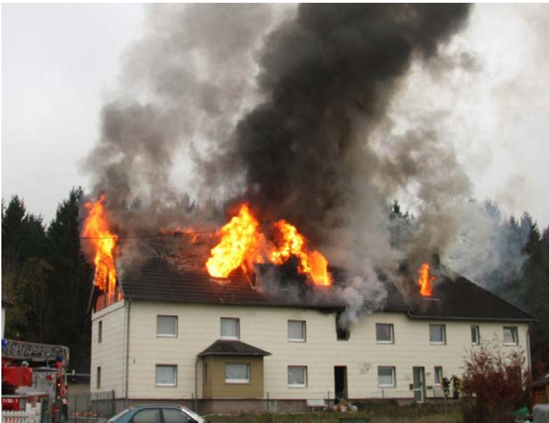
Abbildung 18: Erste Frontalansicht bei einem Dachstuhlbrand