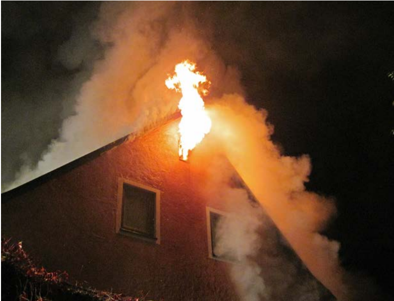
Abbildung 7: Kleinere Flammenverlängerung aus einem Giebelfenster

Der gleiche Effekt lässt sich auch bei einem Schweißbrenner erkennen: Stellt man die Sauerstoffzufuhr ab, so wird die Flamme deutlich länger – die Verbrennung benötigt mehr Zeit, da der entsprechende Sauerstoff aus der Umgebung erst in die Flamme eingemischt werden muss.