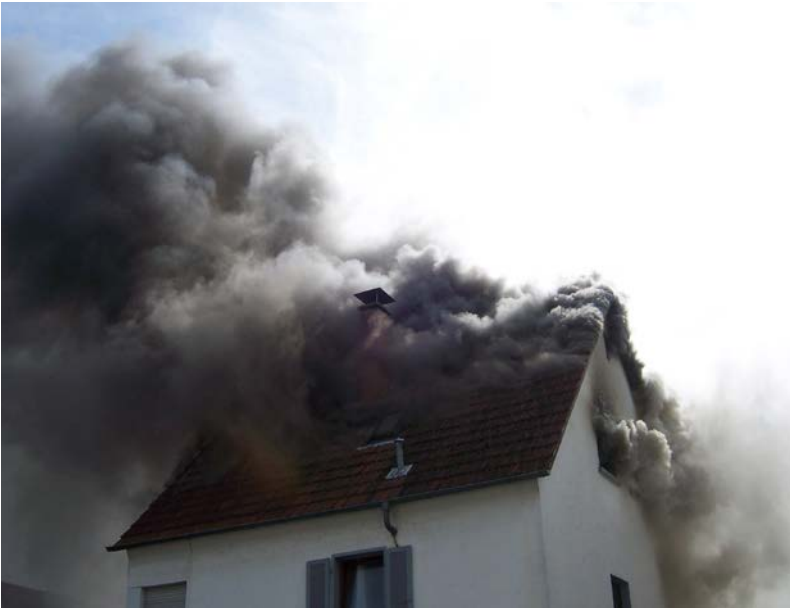
Abbildung 10: Sehr starke, dunkle und turbulente Rauchentwicklung – ein Hinweis auf eine mögliche Rauchgasdurchzündung? Die etwas dunklere und gerade aufsteigende Rauchsäule im linken Dachbereich spricht eher für einen aufgebrannten Dachstuhl und die grünlich-weiße Färbung des Rauches aus dem Giebelfenster für ein erstes Wirken der Brandbekämpfung.