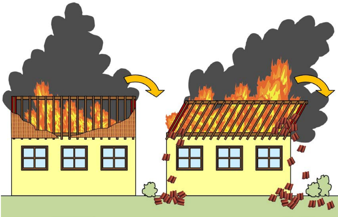
Abbildung 14: Eine zur Seite hin einstürzende Giebelwand kann über die Firstpfette auch die Sparren und die zweite Giebelwand mitreisen.

Hiervon sind jedoch nicht nur die Sparren betroffen. Auch die beiden Giebelwände verlieren mit dem Dachstuhl ihre Stabilität. Giebelwände stürzen in der Regel beim Versagen nach außen. Achtung: Bei einem Einsturz einer Giebelwand kann die Firstpfette die Sparren und sogar die zweite Giebelwand mitreisen. Der Dachstuhl und die Giebelwände kippen dann wie ein Parallelogramm zu einer Seite hin um.