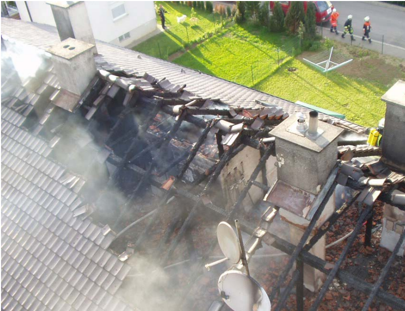
Abbildung 2: Der Dachstuhlbrand hat sich zur linken Giebelseite hin ausgebreitet

Besonders groß ist diese Gefahr bei Doppelhäusern mit durchgehender Dachkonstruktion. Hier stellen die Giebelwände keine brandschutztechnische Abtrennung dar. Das Feuer kann sich hier schnell auf die andere Haushälfte ausbreiten.