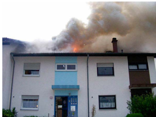
Abbildung 3: Dachstuhlbrand in einem Doppelhaus; das Feuer hat sich von der linken auf die rechte Doppelhaushälfte ausgebreitet