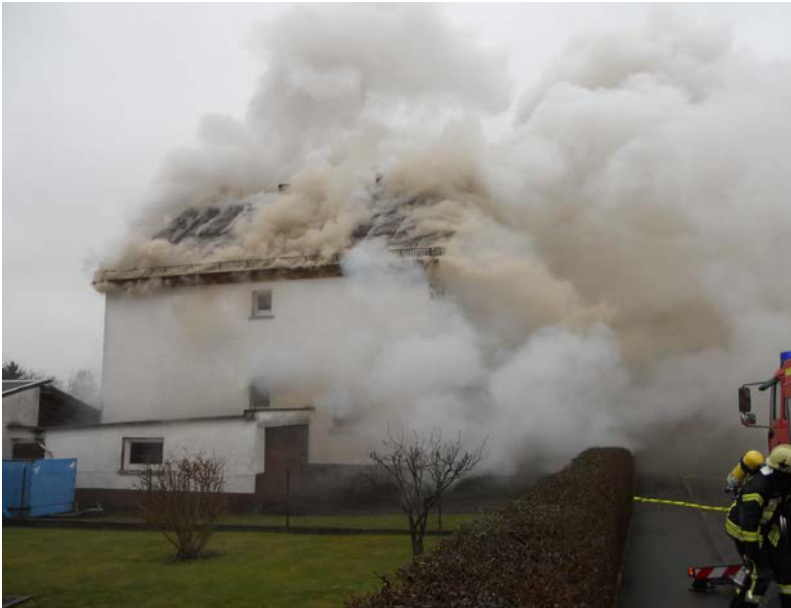
Abbildung 9: Turbulenter Rauch mit einer Braun-/Gelbfärbung – ein Hinweis auf die Pyrolyse von Holz – kurz vor der Rauchgasdurchzündung des hölzernen Dachstuhls