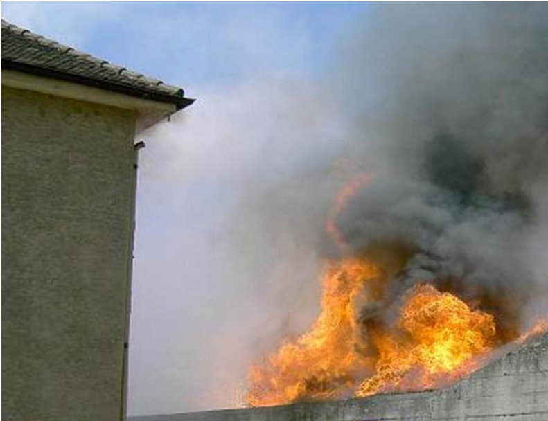
Abbildung 12: Gefahr der Ausbreitung durch Wärmestrahlung – eine leichte Rauchentwicklung ist im Bereich des Dachvorsprungs bereits erkennbar