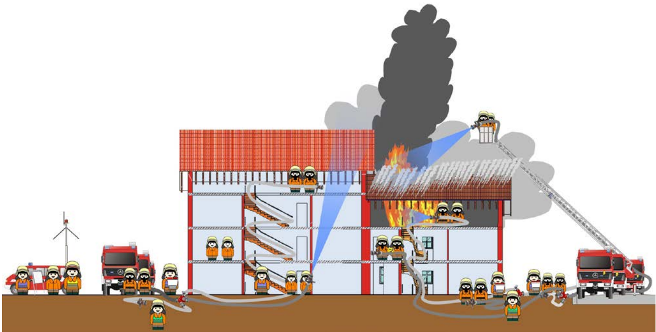
Abbildung 20: Lagebild zum Einsatzbeispiel

Der ELW 1 und die Führungsgruppe unterstützen den Kommandant bei der Einsatzleitung. Dieser hat mittlerweile noch einen weiteren Löschzug, als Taktische Reserve und zum Austausch von Atemschutzgeräteträgern sowie den Gerätewagen Atemschutz des Landkreises nachalarmiert.