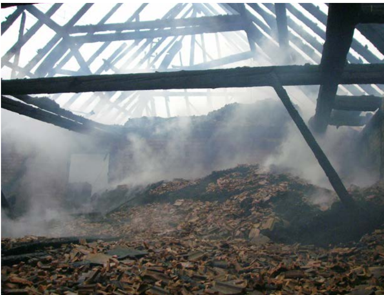
Abbildung 13: Abgestürzte Ziegel nach einem Dachstuhlbrand

Man muss also 15 bis 30 Minuten nach Beginn des Brandes mit dem Versagen der Dachlatten und dem Einsturz der Ziegel rechnen.