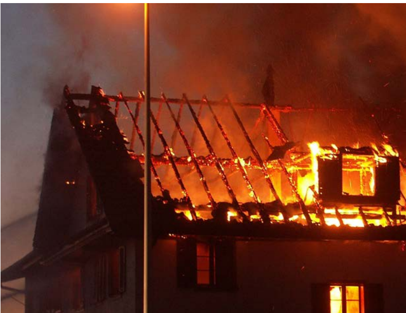
Abbildung 11: Deutlich ist das sich im Treppenraum nach unten hin ausbreitende Feuer zu erkennen

Hat das Feuer bereits auf den gesamten Dachstuhl übergreifen, so wird sich das Feuer im weiteren Verlauf nach unten hin ausbreiten. Der erste Weg hierzu ist der Treppenraum. Herabfallende brennende Teile führen hier schnell zu einer Ausbreitung.