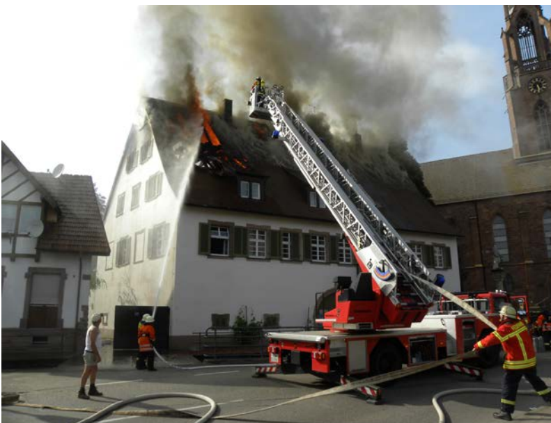
Abbildung 1: Der Brand breitet sich von der linken Giebelseite auf den restlichen Dachstuhl aus

Allgemein droht bei Bränden die Gefahr der Ausbreitung aufgrund der Thermik des Brandrauches nach oben. Bei einem Dachstuhlbrand ist diese Problematik im Normalfall nicht gegeben. Hier steht die Ausbreitung zu den Seiten hin im Vordergrund. Eine Ausbreitung zur Seite hin wird zuerst den restlichen Dachstuhl betreffen.