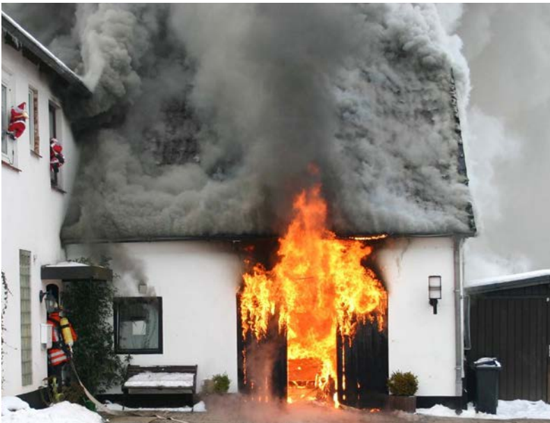
Abbildung 6: Das Feuer im Erdgeschoss hat sich schon auf den Dachstuhl ausgebreitet; dieser steht kurz vor dem Aufbrennen

In der ersten Phase des Aufbrennens lassen sich oftmals, aufgrund der starken Raumentwicklung über dem Dachstuhl, die eigentlichen Flammen noch gar nicht erkennen. Ein sicheres Anzeichen für ein erfolgreiches Aufbrennen ist in dieser Phase, wenn eine dunklere und deutliche schnellere Rauchsäule aus der relativ hellen Rauchwolke über dem Dachstuhl emporsteigt.