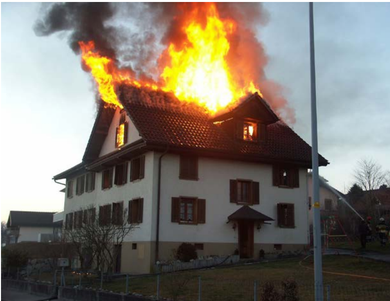
Abbildung 4: Im Firstbereich aufbrennender Dachstuhl