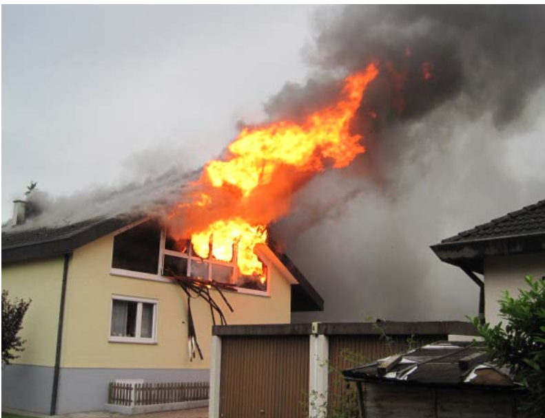
Abbildung 8: Große Flammenverlängerung bei einem Dachstuhlbrand, hierbei kann es zur erheblichen Ausbreitungsgefahr für die Nachbargebäude kommen